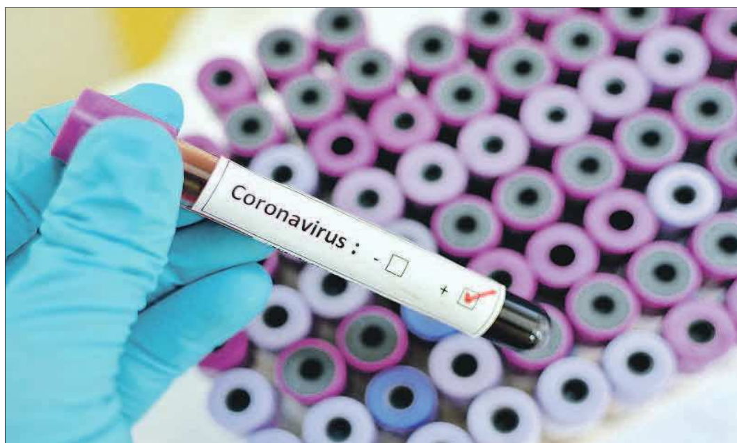
Test de coronavirus.